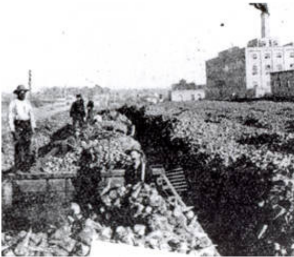
Los trabajadores hispanos de la fábrica de remolacha de azúcar "Great Western Sugar Factory" en el fondo. (H03125)