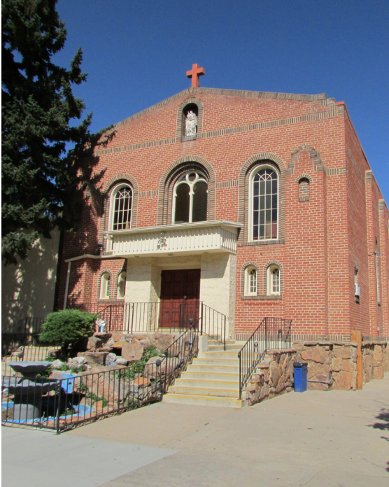
La Iglesia Católica "Holy Family" en 326 N. Whitcomb Street ha sido un centro social y cultural para la comunidad latina de Fort Collins desde que la comunidad construyó la iglesia en 1929.

Nuestra meta es reconocer los lugares que reflejan la historia completa de nuestra comunidad. Si tiene historias, fotografías o pistas que puedan ayudarnos a investigar e identificar los lugares importantes en Fort Collins asociados con la historia latina y otras historias subrepresentadas, por favor comuníquese con nosotros en preservation@fcgov.com .